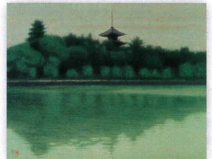
5・6月 緑映猿沢の池 奈良興福寺