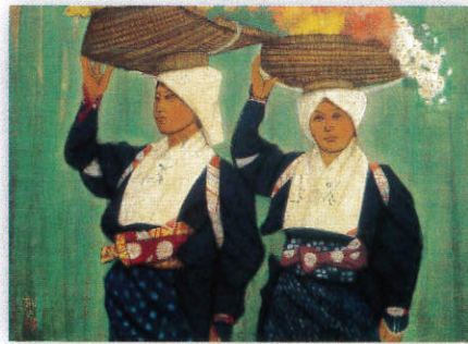
3・4月 浄花白川女 母娘