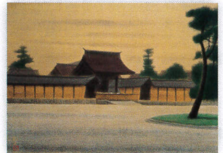
11・12月 京都御所宜秋門