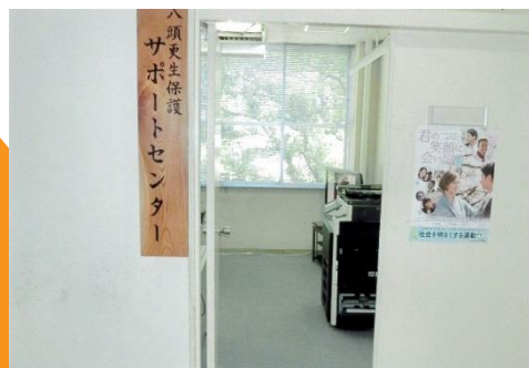
サポートセンター入口