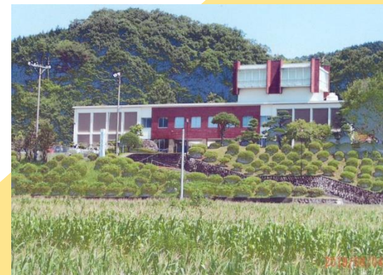
サポートセンターの入っている 八頭中央公民館

開所日 火・木・土曜日 開所時間 午前10時～午後4時 住所 鳥取県八頭郡八頭町宮谷80 電話 0858-71-0771 / FAX 0858-71-0772 e-Mail yazu-saposen@ace.ocn.ne.jp