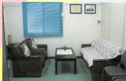
更女事務室は来客等の応接室としても併用