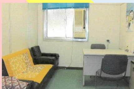
主に対象者の面接に使用