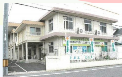
サポートセンター外観

開所日 月曜日～金曜日（祝日・年末年始を除く） 開所時間 午前9時～午後4時 住所 広島県広島市西区小河内町1-8-5 電話 082-208-1217 / FAX 082-208-1218