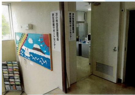
サポセン事務室の入口

入口の左側から見たサポートセンター事務室。机との間にパーティションを置いて、手前のテーブルで面接を行う