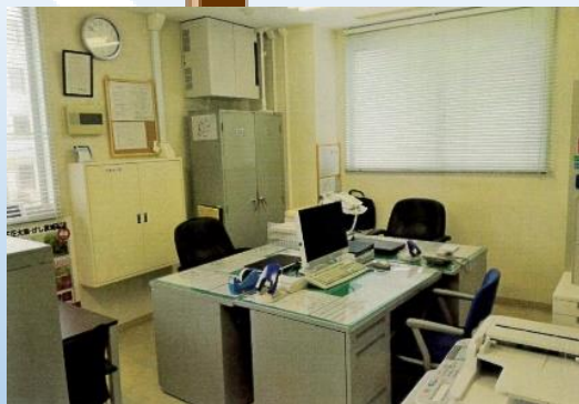
入口から見たサポセン事務室

開所日 平日（月曜日～金曜日） 開所時間 午前9時～午後5時 住所 北海道苫小牧市旭町4丁目4-9 苫小牧市第2庁舎2F 電話/FAX 0144-34-5611