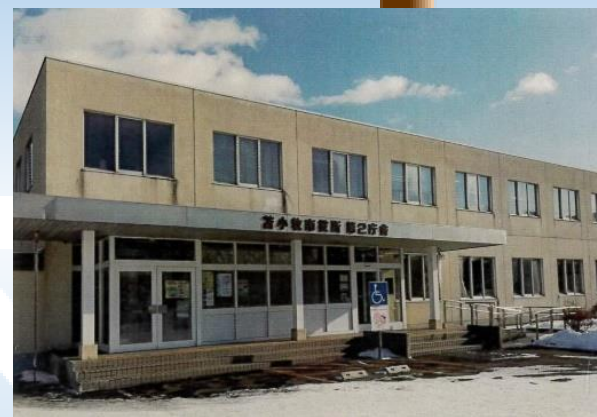
苫小牧市役所第2庁舎