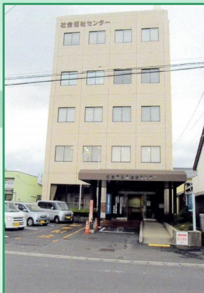
入居施設外観 (3Fに入居)

開所日 月曜日～金曜日（12月29日～1月3日を除く） 開所時間 午前9時～午後4時 住 所 〒693-0001 島根県出雲市今市町543番地 出雲市社会福祉センター3F 電 話 0853-22-7190 / FAX 0853-22-7191