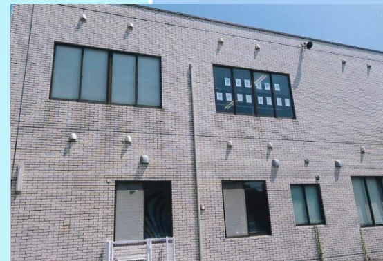
サポートセンターの外観