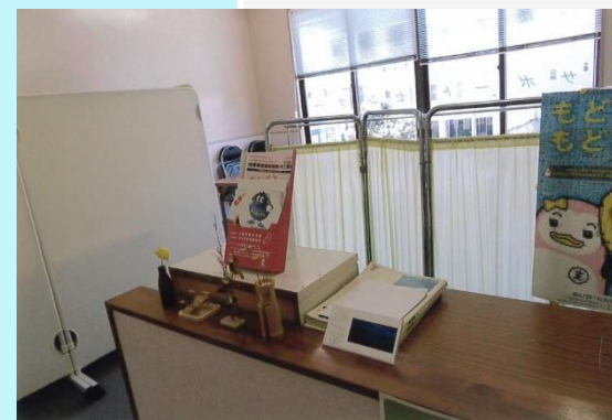
サポートセンターの事務室の様子