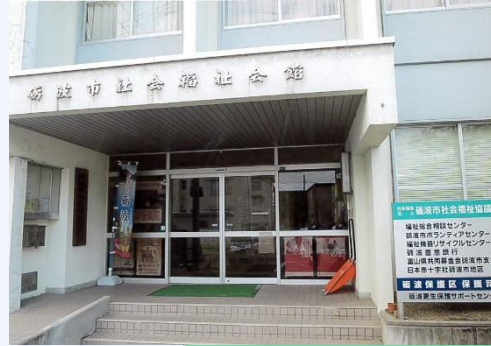
入居施設玄関及びサポートセンター表示板