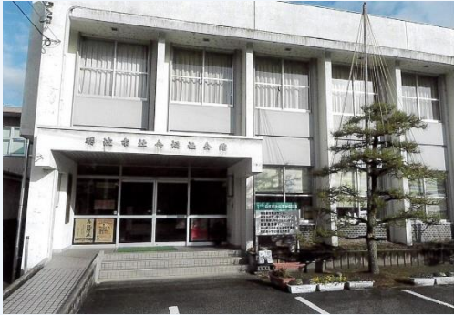
サポートセンターが入居している社会福祉会館

開所日 月・水・金曜日 開所時間 午前10時～午後4時 住所 富山県砺波市幸町8-17 電話 0763-23-6565 / FAX 0763-33-6324