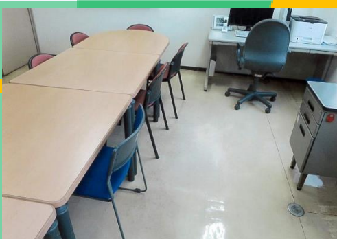
サポートセンター事務室