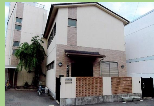
サポートセンター外観