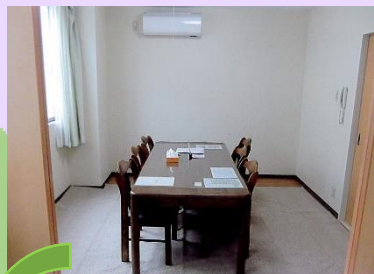
面接室・会議室兼用