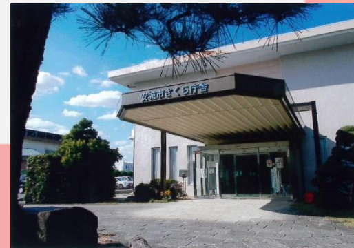
サポートセンターの施設（市役所さくら庁舎）の外観