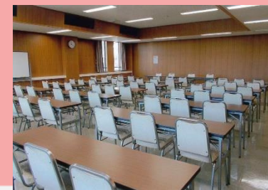
さくら庁舎2Fの会議室 定例保護司会の会場として使用 しています