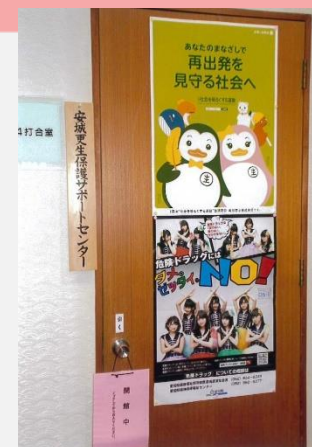
サポートセンター入口

今では、保護司会の事務拠点として、また新任保護司等の研修の場として、対象者等との定期面接の場として、更生保護関係団体との協議の場として、関係保護司同士の情報交換の場として重要な役割を果たす場となっています。