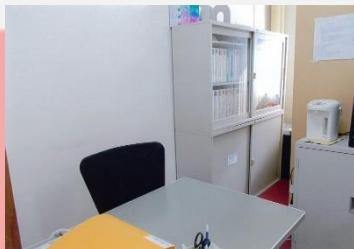
サポートセンター内部

開所日 月曜日～金曜日（祝日を除く） 開所時間 午前9時～午後4時 住 所 愛知県安城市桜町19番13号 電話/FAX 0566-72-7010