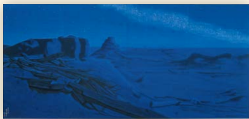
7・8月 楼蘭の遺跡 夜