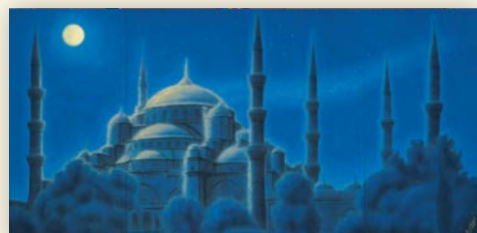
11・12月 皓月ブルーモスク イスタンブール