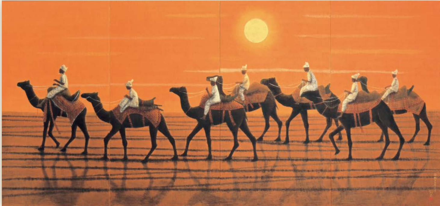
表紙 シルクロードを行くキャラバン(東・太陽)