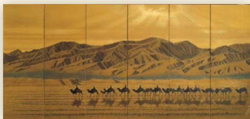
1・2月 絲綢之路天空