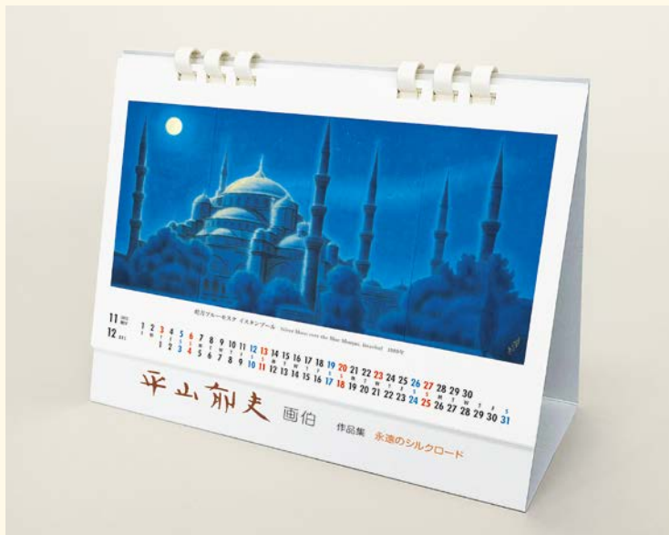
表面は、作品を掲載。