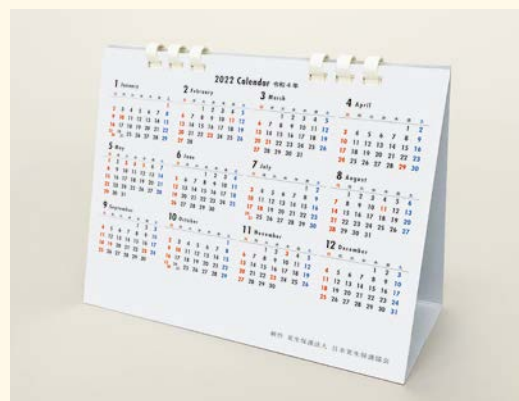
台紙裏には、1年分のカレンダーを掲載。