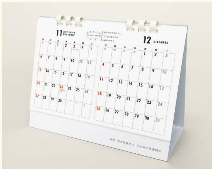
裏面は、書き込みができる2か月分の月間カレンダーになっています。